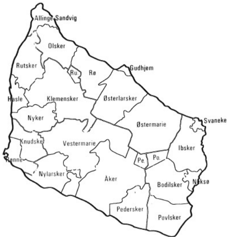
Figur 1. Bornholmske sogne

I den efterfølgende analyse er de fire bornholmske kommuner inddelt i følgende 14 lokalområder: