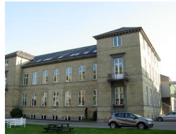
Afdeling på Frederiksberg, Kbh.