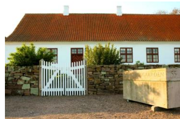
Hovedkontor i Nexø, Bornholm

Center for Regional- og Turismeforskning er et center for anvendt forskning, der løfter analyse- og udviklingsopgaver samt forskningsprojekter med særligt fokus på yderområder. Centrets primære fokus er regional udvikling med fokus på yderområder, turisme i et destinationsperspektiv samt modeløkonomisk analyse. CRT er beliggende på Bornholm og har eksisteret siden 1994.